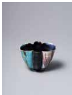
ルーシー・リー《鉢》1926年頃 個人蔵