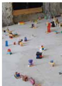
「落石計画第1期 ワークショップ Community on the move / 落石」2008年

*目黒区在住、在勤、在学の方は、受付で証明書類提示で団体料金に。 https://mmat.jp/ ★お問い合わせ：03-3714-1201