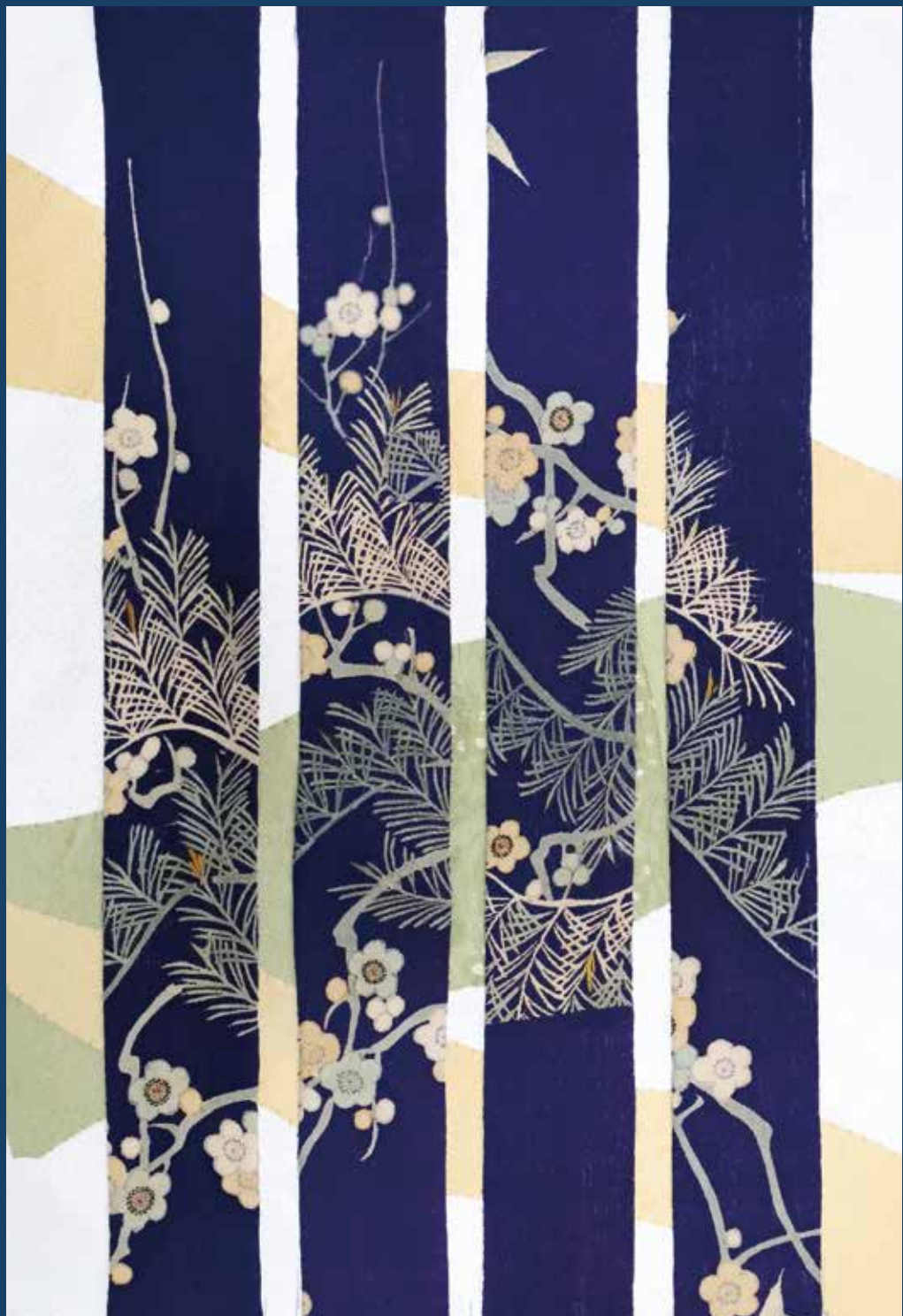
古布コラーージュ「和色一紺瑠璃」 古布コラーージュ・アーティスト 住川 信子