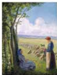
カミーユ・ピサロ《羊飼いの女》1887年頃 展示期間 6月16日(火)～8月16日(日)