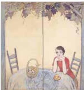
《憩い(女)》昭和初期 絹本着色 夢二郷土美術館蔵