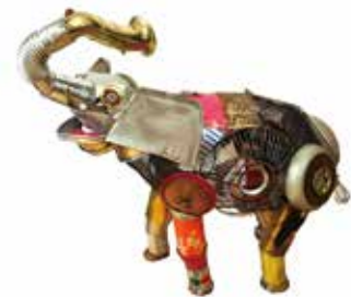
「パオラ」118.0x67.0x123.0cm ミクストメディア、金属廃材

★お問い合わせ:Bunkamura Gallery 8/03-3477-9174