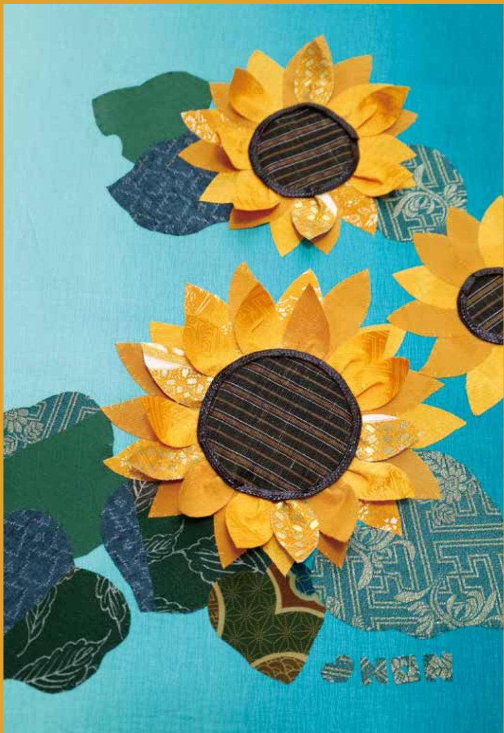
古布コラージュ「和色ーウコン色」 古布コラージュ・アーティスト 住川 信子