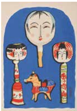
《おもちゃ繪 諸國めぐり 宮城》武井武雄 制作年不詳 伝承木版 © 岡谷市/イルフ美術館

大正期、子どものための文化が目覚ましく開花しました。1918(大正7)年には児童雑誌『赤い鳥』が創刊され、「童謡」が誕生します。伝承された昔話や民話だけでなく、これらを基に新たに創作された物語、さらに全く新しい創作童話も発表されました。しかし、当時出版された挿絵は、物語の添え物としかみなされませんでした。このような状況下で、子どものための芸術こそ本物の芸術でなければならない、そのために「童画」という言葉を発案し、これを一つのジャンルとして確立することを目指した武井武雄の生誕130年に創作活動をふりかえる展覧会を開催します。会期:2024年7月6日(土)~8月25日(日)/場所:目黒区目黒2-4-36/10:00~18:00(入館は17:30まで)/休館日:月曜日(7/15と8/12は開館、7/16と8/13は休館)/一般900円、大高生・65歳以上700円、中学生以下無料 https://mmat.jp/ ★お問い合わせ:03-3714-1201