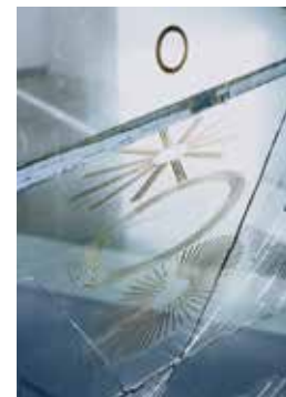
奈良原一高くデュシャン/大ガラスより 1973年

https://topmuseum.jp ★お問い合わせ:03-3280-0099