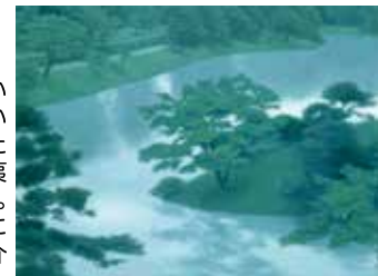
東山魁夷《緑潤う》1976(昭和51)年 紙本・彩色 山種美術館蔵