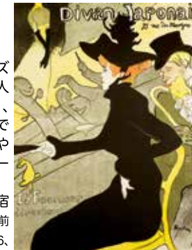
アンリ・ド・トゥールーズ=ロートレック 《ディヴァン・ジャポネ》 1893年 80.8x60.8cm リトグラフ The Firos Collection

会期：2024年9月23日(月)まで／場所：東京都新宿区西新宿1-26-1／時間：10:00～18:00(金曜は20:00まで/入場は閉館30分前まで)／日時指定予約推奨／休館日：月曜日(但し7/15、8/12、9/16、9/23は開館)／一般1,800円、大学生1,200円、小中高生と障がい者手帳をお持ちの方は無料 https://www.sompo-museum.org/ ★お問い合わせ：050-5541-8600(ハローダイヤル)