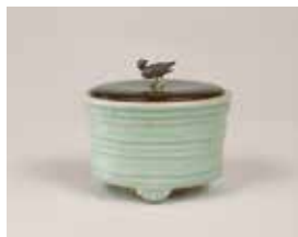
青磁香炉 銘千鳥 大名物 一口 南宋時代 13世紀 徳川美術館 【展示期間：7/3～7/29】

将軍家に連なる御三家の筆頭であった尾張徳川家に受け継がれてきた重宝の数々を所蔵する徳川美術館。家康の遺品「駿府御分物」をはじめ、歴代当主や夫人たちの遺愛品から、刀剣、茶道具、香道具、能装束などにより、尾張徳川家の歴史と華やかで格調の高い大名文化をご紹介します。とくに屈指の名品として知られる国宝「源氏物語絵巻」と、三代将軍家光の長女千代姫が婚禮調度として持参した国宝「初音の調度」も特別出品される貴重な機会となります。