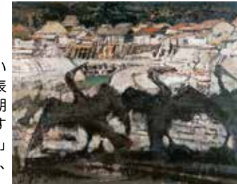
須田国太郎《稿》1952年 京都国立近代美術館蔵

会期：2024年7月13日(土)～2024年9月8日(日) 場所：東京都世田谷区砧公園1-2／時間：10:00～18:00(入館は17:30まで) 休館日：毎週月曜日(7/15、8/12は開館、7/16、8/13は休館) 一般1,400円、65歳以上1,200円、大高生800円、中小生500円 https://www.setagayaartmuseum.or.jp/ ★お問い合わせ先：050-5541-8600(ハローダイヤル)